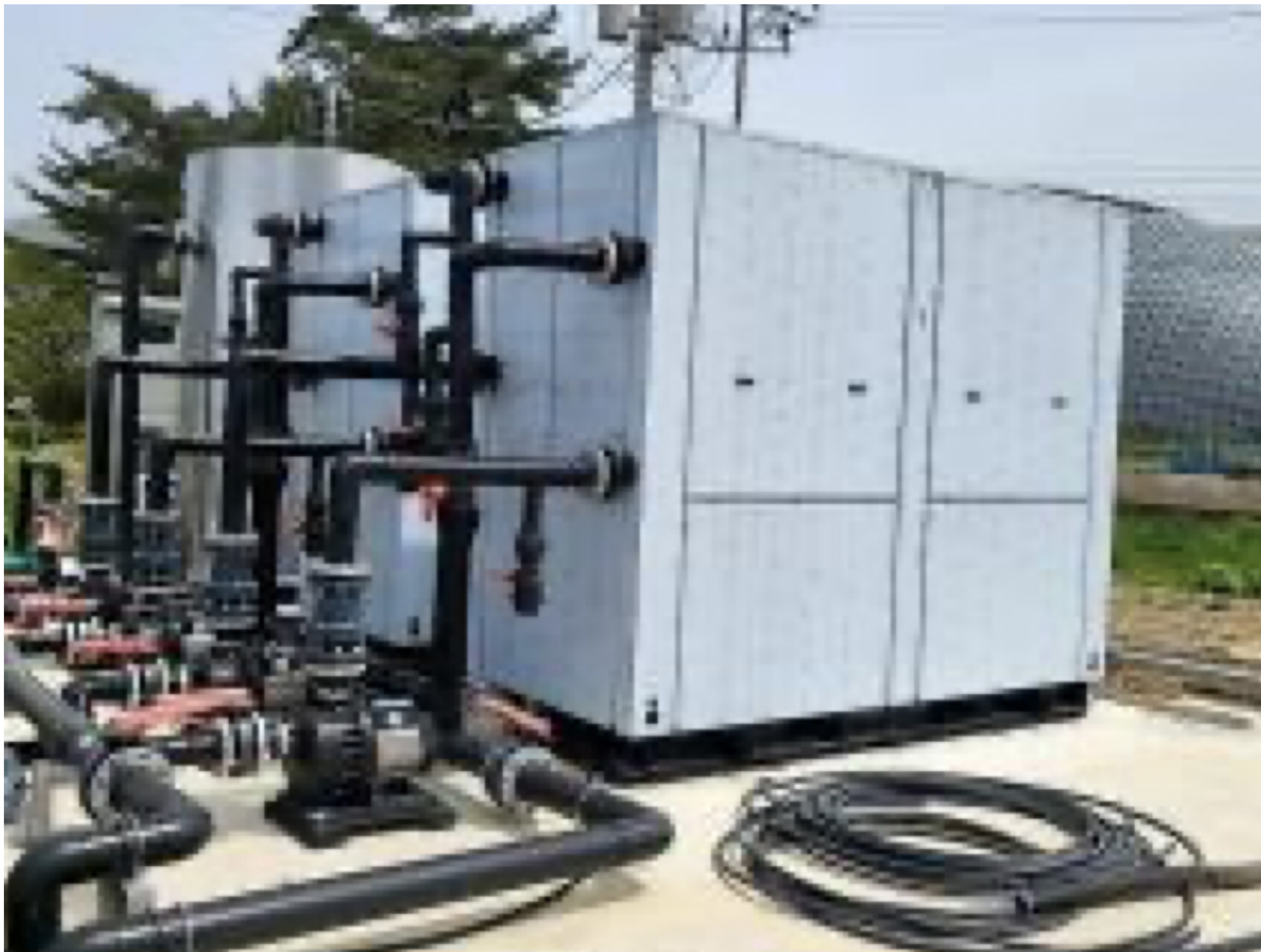
< 히트펌프 >