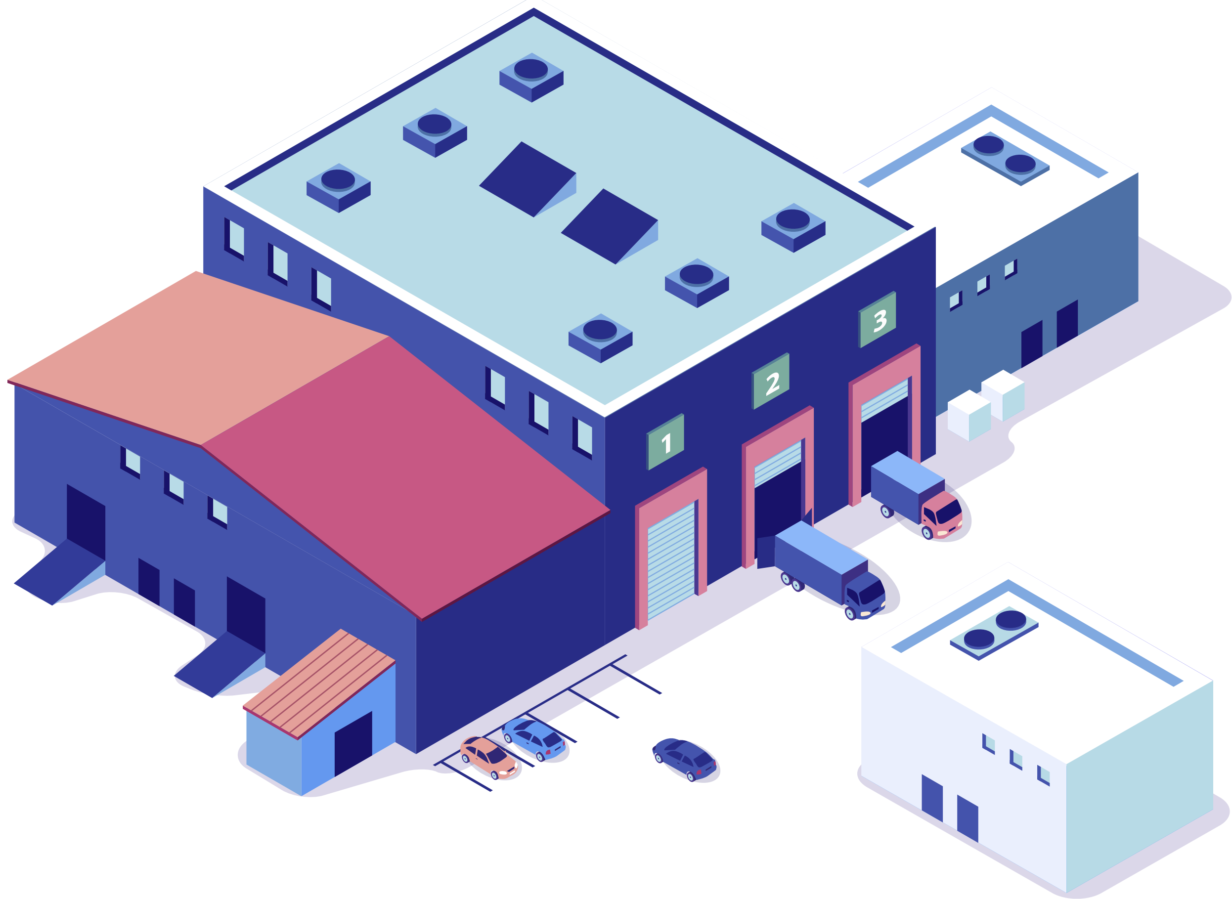
< 해남 수산식품산업 거점단지 >