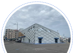
고흥군 수협 청정위판장 전경