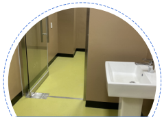
선어 위판장 출입 통로