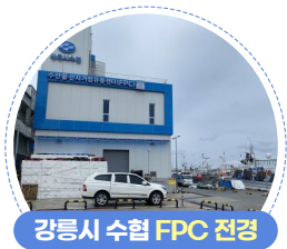
강릉시 수협 FPC 전경