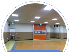
선어 위판장 어업인 대기실 입구