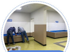
활어 위판장 문어 및 낙지 선별 수조