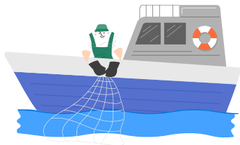
생산 비중 70% 이상