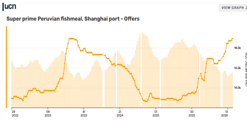
〈페루산 어분 중국 시장 가격 추이〉